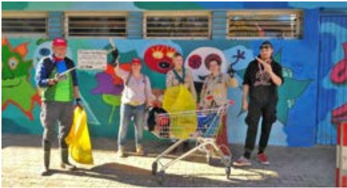
Fleißige Müllsammler bei Herbstaktion des Runden Tisch Umwelt.

Am Nachmittag startete eine Gruppe vom Nachbarschaftstreff im Zehntsteinweg 4 und sammelte auf dem Weg zum Betzenhauser Torplatz Müll auf. Gleichzeitig konnten sich Anwohnende am Betzenhauser Torplatz Material zum Müll sammeln ausleihen. Dies wurde von der Stadt Freiburg im Rahmen der an diesem Tag stadtweit stattfindenden Müllsammelaktion „Freiburg putzt sich raus“ gestellt. Für eine Stärkung sorgten Jugendliche des Jugendzentrums Chummy. Sie versorgten die Helferinnen und Helfer mit Waffeln und Getränken.