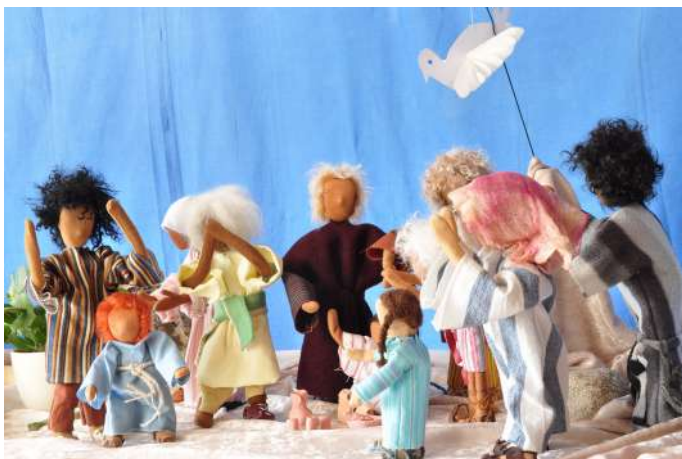
Der Lichtweg - von Ostern bis Pfingsten

Montag, 12. April und Montag, 3. Mai , jeweils um 15 Uhr im Gemeindezentrum (bis 17 Uhr). Die Veranstaltung findet unter Einhaltung der Abstandsregelungen im Gottesdienstraum