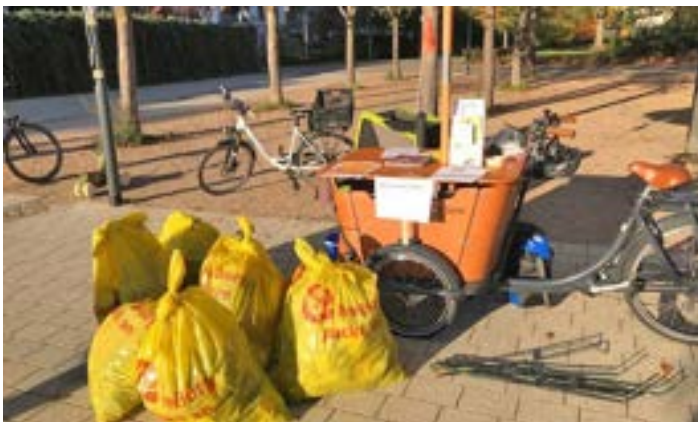
Ein Teil des Ergebnisses der Aktion: Sechs volle Säcke Müll.

Der „Runde Tisch Umwelt“ bedankt sich bei allen Beteiligten für die Teilnahme und Unterstützung und freut sich schon auf die nächste Müllsammelaktion im kommenden Jahr!