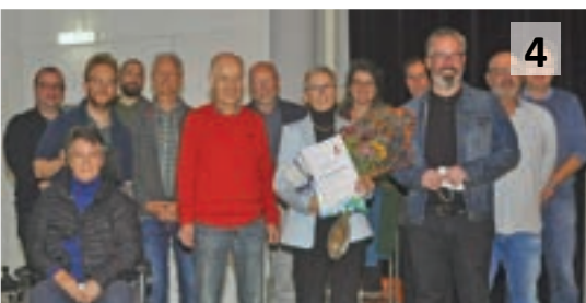
Jahreshauptversammlung am 8. Oktober ...die wir Corona-bedingt auf Anfang Oktober verschoben hatten. Erfreulicherweise sind über 80 Vereins-Mitglieder...