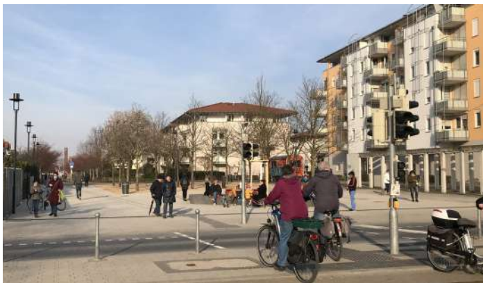
Redaktion. Betzenhauser Torplatz nach Umbau mit neuer Sitzmöglichkeit, dem Blick auf das Wäldchen (hier leider noch nicht grün) und Weitblick bis zum Turm am Bürgerhaus.

Seit Oktober wurde am Betzenhauser Torplatz gebaut. Sicher haben viele von Ihnen interessiert auf die Baustelle geschaut. Schnee und Corona haben für leichte Verzögerungen gesorgt, aber jetzt ist der Zaun weg und man kann über den neuen, jetzt offen gestalteten Platz laufen.