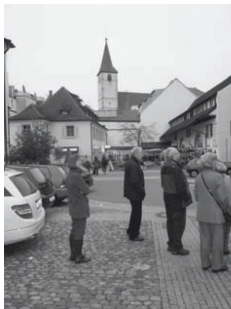
Freiburger in Müllheim

Geschichte des Markgräfler Landes, zeigte die Erdgeschichte und Menschheitsgeschichte von den Anfängen bis in die Gegenwart, erklärte die Geschichte Müllheims und zeigte Kunstwerke regionaler Künstler. Das stramme Programm wurde den Teilneh-