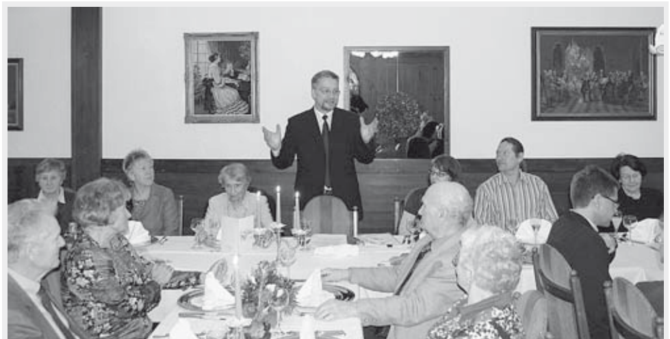
Neujahrssessen der CDU Betzenhausen-Bischofslinde.