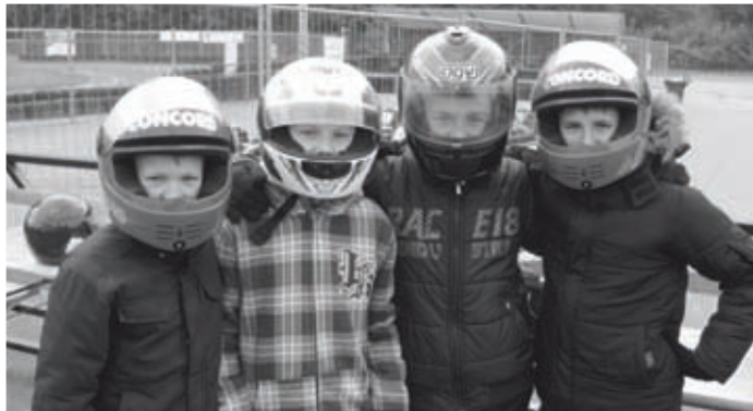
Auf der Kartbahn

Seit Mai diesen Jahres hat das neue Jugendzentrum Chummy in Betzenhausen geöffnet. In erster Linie bietet Chummy für Jugendliche im Alter von 12 bis 18 Jahre ein wöchentliches bunt