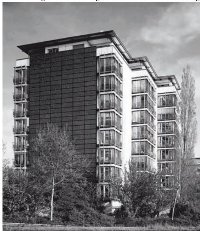
Stadt bekannt: Die Solarfassaden an den Wohnanlagen entlang der Wilmsdorfer Straße, errichtet von der Familienheim Freiburg, nutzen die Sonnenenergie optimal aus.

Bei den stetig steigenden Energiepreisen gehören Energieeffizienz und nachhaltiges Wirtschaften im Hinblick auf kommende Generationen zu den zentralen Aufgaben einer Genossenschaft. Während die Kaltmieten seit 1995 bundesweit um 22 Prozent gestiegen sind, haben die Energiekosten um 120 Prozent zugelegt. Das wirft jedoch gleich die Frage auf, wer eigentlich für die Sanierungskosten zuständig ist? Die oft zitierte Darstellung,