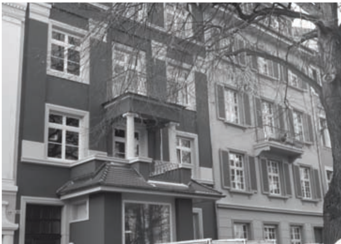
Bei diesen beiden Mehrfamilienhäusern in der Sautierstraße gelang der Heimbau Breisgau der Spagat, eine moderne energetische Sanierung unter Berücksichtigung von denkmalpflegerischen Aspekten auszuführen.

Klimaschutz und Klimawandel sind in aller Munde, die Reduzierung des klimaschädlichen CO 2 -Ausstoßes durch Energieeinsparung ist derzeit oberstes Gebot. Eines der größten Potentiale steckt dabei in der energetischen Sanierung von Gebäuden. Seit fast 20 Jahren leisten die Freiburger Wohnungsbau-genossenschaften Bauverein Breisgau, Familienheim Freiburg und Heimbau Breisgau mit ihrer kontinuierlichen Modernisierung einen wichtigen Beitrag zum Klimaschutz – und haben bislang rund 165 Millionen Euro in diese Aufgabe investiert. Bis 2020 wollen sie mit den Sanierungen fertig sein.