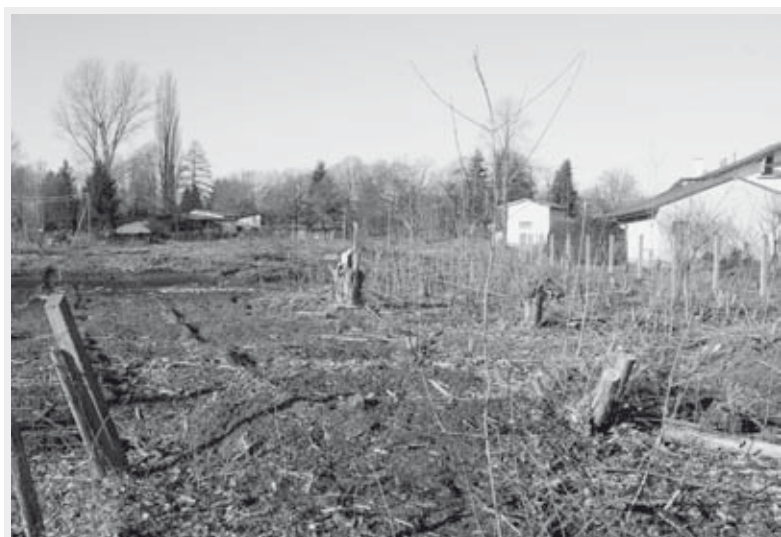
Pleugergelände am 16.1.2011.