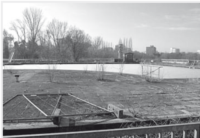
Das Freibad West Anfang 2009. Inzwischen ist der Verfall weiter fortgeschritten.