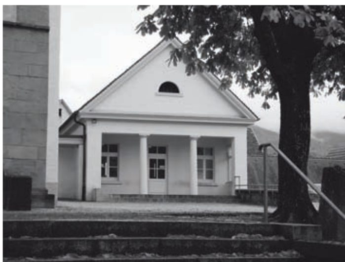
Klassizismus im Kleinen

Am 31.10. bot der Kultur- und Geschichtskreis allen Interessierten eine besondere Fahrt, wartete doch die besuchte Stadt für die Teilnehmer mit einem prallen Programm auf: einer Altstadt