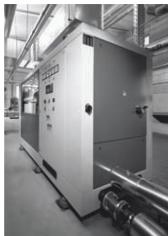
Seit rund 10 Jahren stattet der Bauverein Breisgau Energiezentralen mit effizienter Kraft-Wärme-Kopplung aus. Durch die getrennte Strom- und Wärmeerzeugung werden jährlich ca. 2.100 Tonnen CO 2 gegenüber der konventionellen Strom- und Wärmeproduktion eingespart.

Mit dem gezielten Einsatz von regenerativen Energien leisten die Freiburger Wohnungsgenossenschaften einen weiteren Beitrag zu den Klimaschutzzielen der Green City. So unterstützen Solaranlagen bei allen drei Genossenschaften die Energieerzeugung. Energiezentralen mit Kraft-Wärme-Kopplung sind beim Bauverein Breisgau bereits seit zehn Jahren im Einsatz. Weitere Beispiele: Die Heimbau Breisgau unternahm mit Erfolg den schwierigen Spagat, zwei ältere Wohnanlagen sowohl energie-