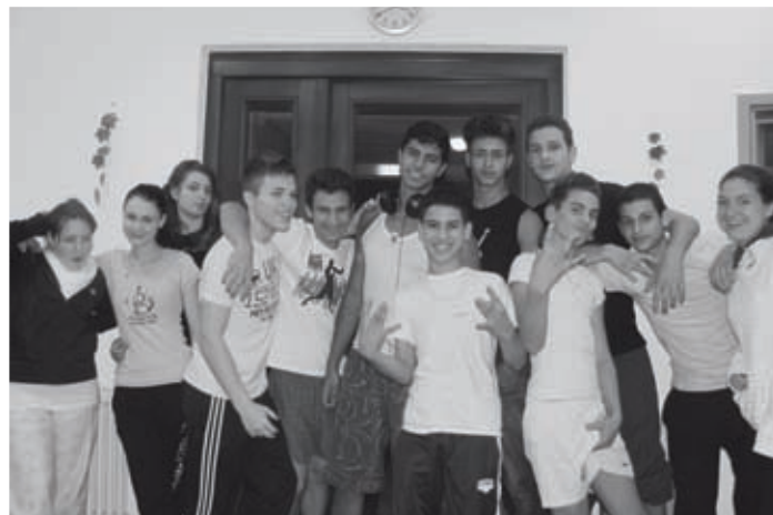
Übernachtung im Jugendzentrum

In den Herbstferien fanden für die Jugendlichen mehrere beson-